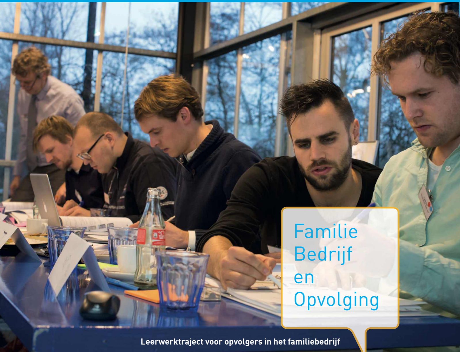
Leerwerktraject voor opvolgers in het familiebedrijf